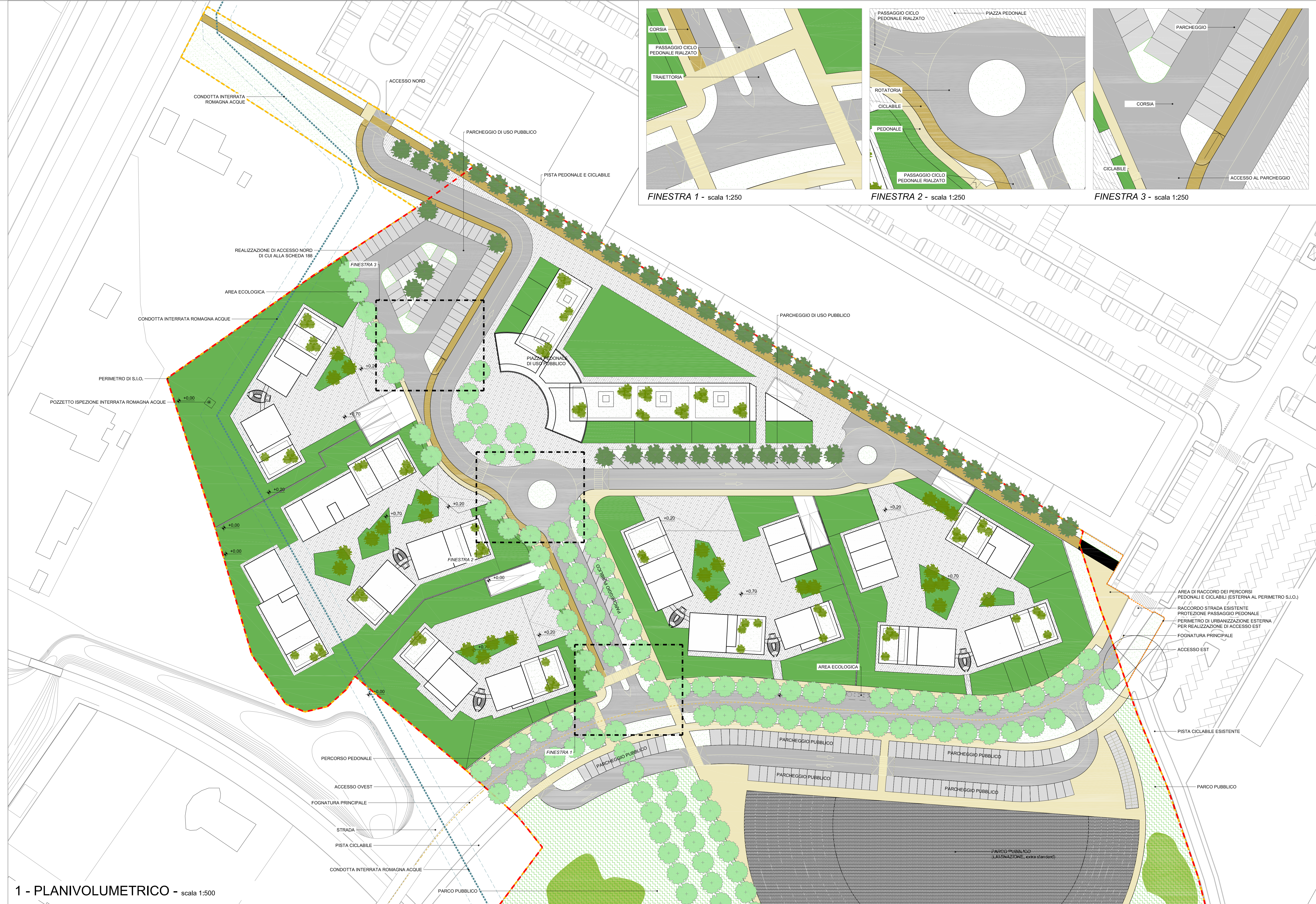
1 - PLANIVOLUMETRICO - scala 1:500