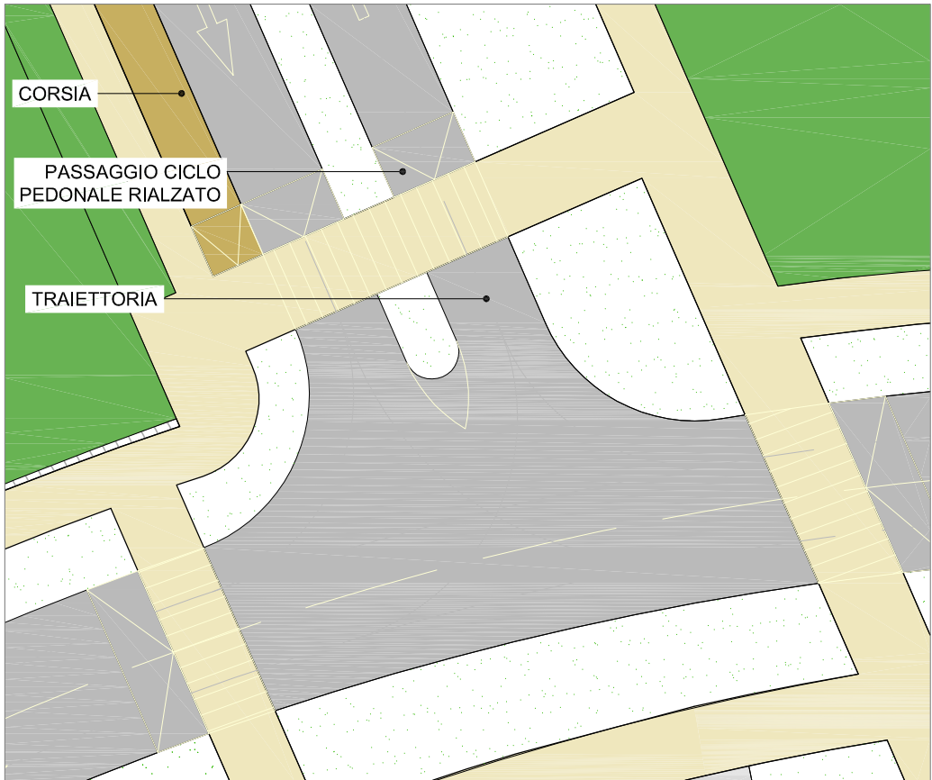
FINESTRA 1 - scala 1:250